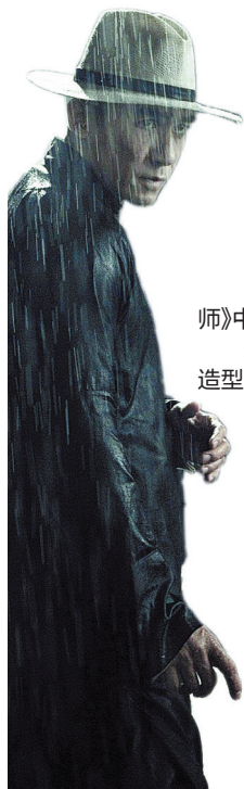
梁朝伟在《一代宗师》中的叶问造型 宋慧乔的“叶太太”造型