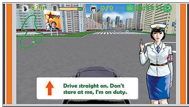
朝鲜首款网游“平壤赛车”画面截图