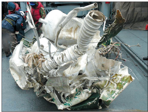
韩国打捞上来的朝鲜火箭残骸

综合外国媒体报道,韩国国防部12月23日公布了对打捞出朝鲜“银河3号”一级火箭残骸的调查结果。韩方认为,朝鲜导弹的射程已经能够覆盖美国西海岸等地区。