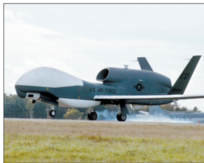
“全球鹰”无人驾驶飞机