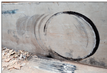
车的左前轮在墙上留下的轮胎印