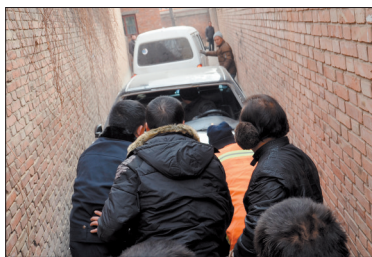
11时58分,面包车拉众人推,车终于动了