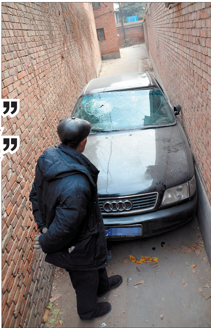
小胡同东宽西窄,奥迪车进得来出不去