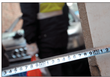
胡同口最窄处1.38米宽

“已经查实这是一辆套牌车。”南昌路派出所交巡大队民警闫洪伟介绍,根据现场勘验的结果以及群众反映的情况来看,奥迪车的驾驶人员对附近路况并不熟悉,可以推测不是附近居民。目前,不排除当事人酒后驾车或盗窃他人车辆的可能。