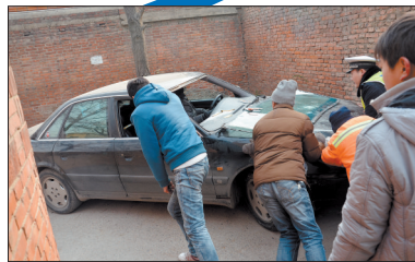
12时6分,车被推到第一个转弯处