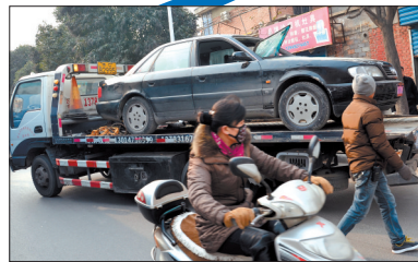
12时30分,脱困车辆被拖走