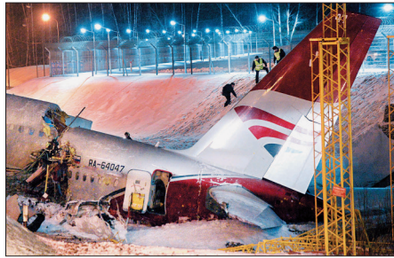
工作人员在客机失事现场调查

一架俄罗斯客机29日下午在莫斯科一座机场着陆时冲出跑道、在一条公路上断成3截,8名机组成员中4人丧生,机上没有乘客。俄罗斯相关部门已成立专门小组,调查客机失事原因。