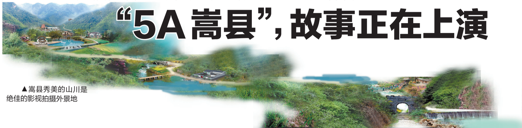
▲嵩县秀美的山川是绝佳影视拍摄外景地