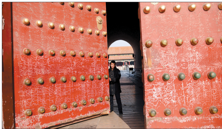
一月七日,工作人员关闭故宫午门入口