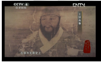
纪录片中,洛阳符号频频亮相(视频截图)