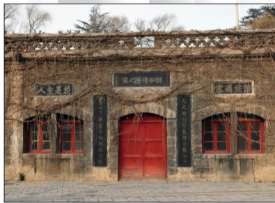
冬日里,千唐志斋景区冷冷清清

我们从市旅游局了解到,在《中国书法五千年》接下来的第6集和第7集中,大家还可以看到洛阳博物馆、千唐志斋等与书法有关的景区。