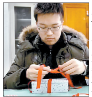
准备把自己做的锤子送给女友