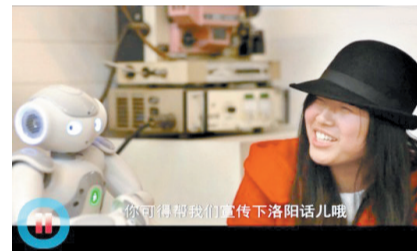
复赛选手《漫话洛阳话》专题视频截图