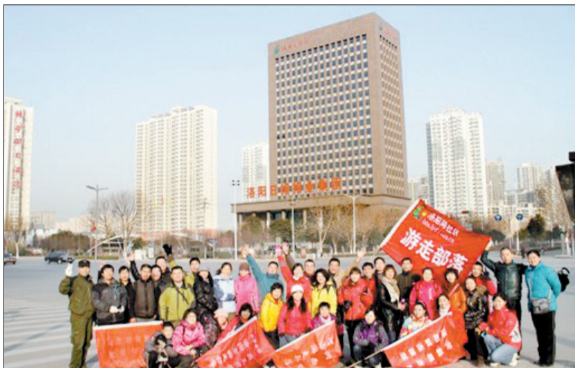
元旦暴走,快乐合影