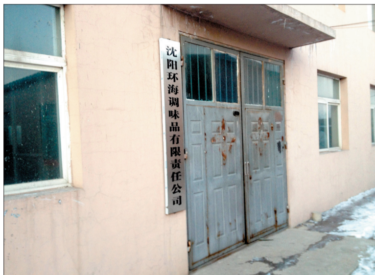
位于沈阳市苏家屯区的一家生产肉精粉等食品调料的企业的企业

加入羊肉香精的开水就可以变成“羊汤”，猪肉涂上牛肉香膏竟能吃出牛肉味，想让肉制品口感鲜嫩可直接加入嫩肉粉……如今这些轻易就能改变食品特性的各类调味品、添加剂在一些食品批发商城随处可见。这些“变身剂”是否有害呢？