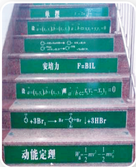
整不死的小强强:据说这是某中学教学楼的楼梯……