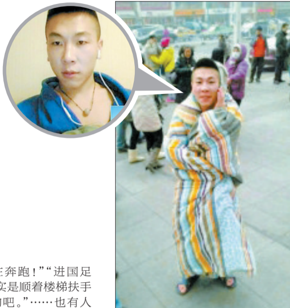
“拖鞋销魂,站姿冷艳”

23日,有网友发微博称,地震“逃生哥”1分钟跑下21楼。有人质疑,有人惊叹他的速度,称足以秒杀博尔特、刘翔等人。也有人称,要是让他穿上刘翔的小短裤,估计再高10层也能轻松逃生。