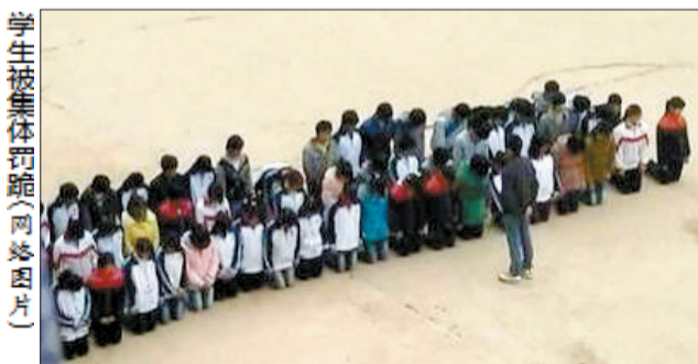
学生被集体罚跪