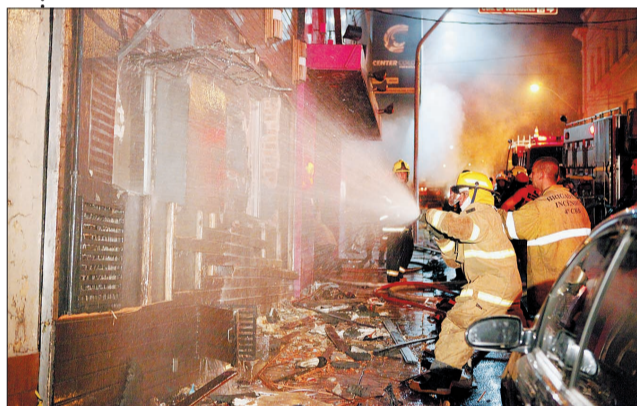
一月二十七日,消防队员在发生火灾的夜总会灭火

这起夜总会火灾,是巴西50余年来死亡人数最多的火灾事故。目前,所有遇难者遗体已被安放在圣玛丽亚市体育中心体育馆内,其中包括120名男性和113名女性,死者身份鉴定工作正在进行中。南里奥格兰德州相关机构将每小时更新一次遇难者名单,而乐队和夜总会的保安人员将以刑事罪被检察院提起诉讼。