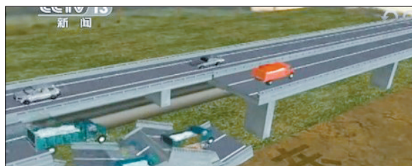
事故发生示意图 (央视新闻视频截图)