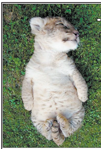
猪太太snow:小狮子的睡相实在太萌了!