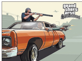
奥巴马成为《侠盗猎车手》游戏里的一个人物