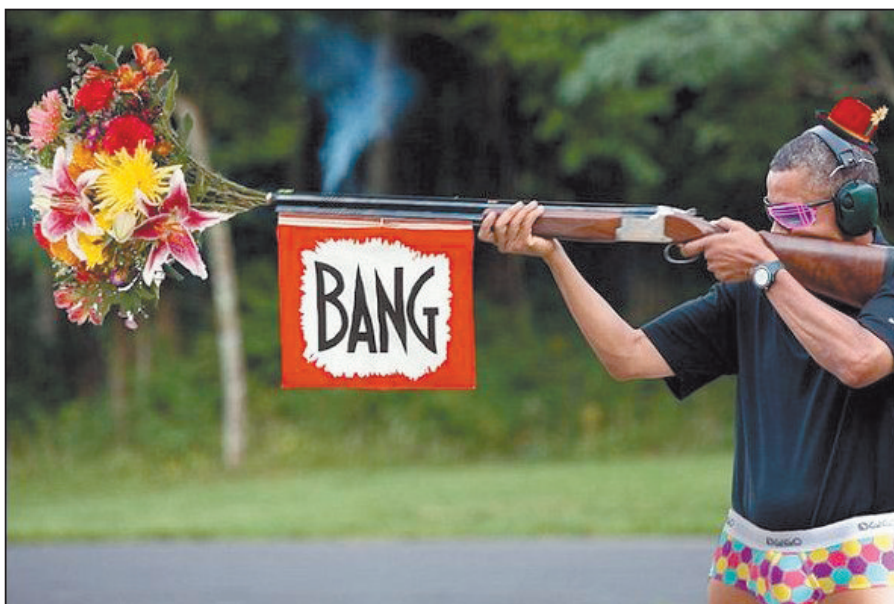
网友恶搞奥巴马照片,开枪变“开花”