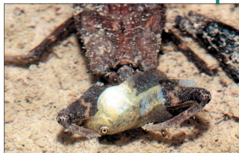
●水蝎子:经常潜伏水底,待猎物进入“射程”,便发起攻击咬住猎物并向其体内注射消化唾液,然后吸食被融化的猎物尸体。