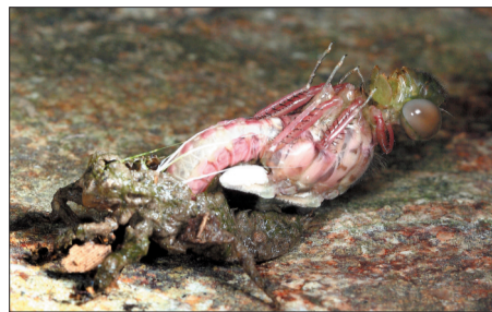
●蜻蜓:水蚤经过几个月甚至几年生长后,慢慢爬出水面开始羽化变成蜻蜓,这个过程通常在夜间进行。