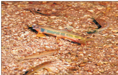
●宽鳍鱲[liè]:山区溪流中的常见鱼类,繁殖时雄鱼体色会变得十分鲜艳,有很强的领地意识,会驱赶其他进入领地的雄鱼。

近日,记者整理了一些生活在洛阳湿地的常见物种和珍贵物种,邀您一起探寻湿地上的生命之趣。