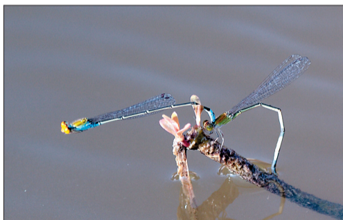
●豆娘:和蜻蜓一样都属于蜻蜓科,肉食性,以比它体小的昆虫为食。繁殖时,雌豆娘将卵产在水草或者植物的茎内。