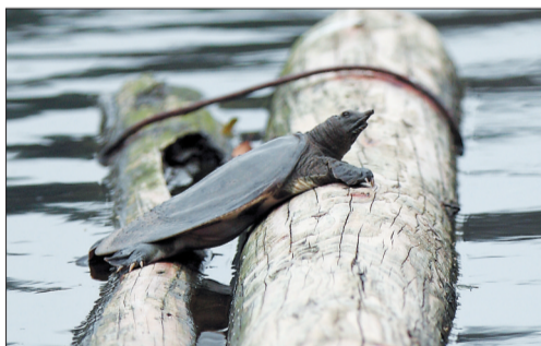
●鳖:用肺呼吸的爬行动物,以肉食为主。风平浪静的白天常趴在向阳的岸边或石头上晒太阳,利用阳光中的紫外线杀死体表的致病菌。