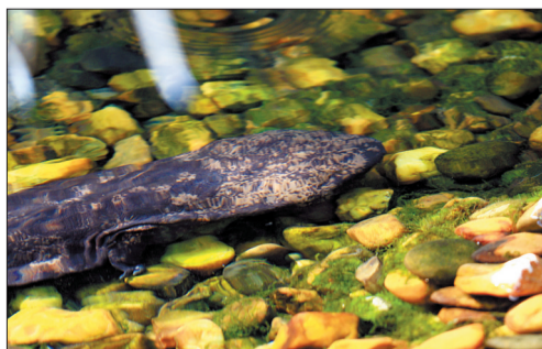
●大鲵:俗称“娃娃鱼”,是两栖动物中体形最大的一种。栖息在山涧溪流中,肉食性,主要以鱼、虾、蛙等为食,为国家二级保护动物。