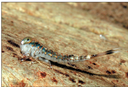
●水蚤[chài]:蜻蜓和豆娘的幼虫,生活在水中,肉食性,捕食小型水生昆虫。大型的水蚤,甚至可以捕食小鱼和蝌蚪。