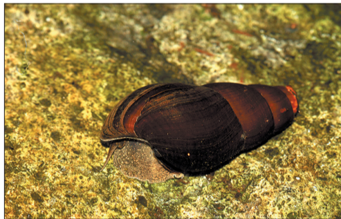
●田螺:软体动物,以藻类和微生物为食。它的胚胎发育和仔螺发育均在母田螺体内完成,孕育时间一年左右。