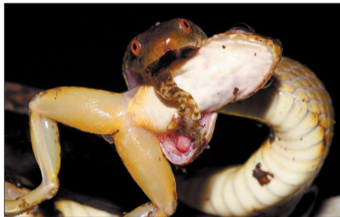
●水蛇:栖息在水边,主要捕食鱼、蛙。五六月份为其繁殖期,一场雨后能见到几十条水蛇追逐,争夺交配权。