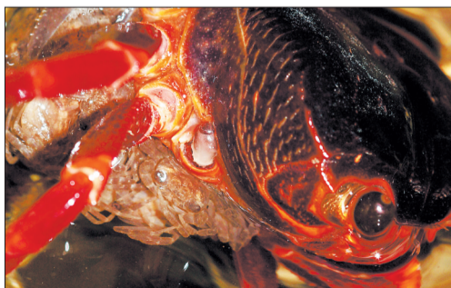
●螃蟹:甲壳纲动物,素有清道夫之称,经常以其他动物尸体为食。繁殖时,一串串卵附在雌蟹的腹部,直到孵出小螃蟹。