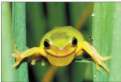
●雨蛙:初夏雨后,常常一只雨蛙先叫几声,然后众蛙齐鸣,声音响亮。雨蛙主要以昆虫为食,能抑制害虫泛滥。