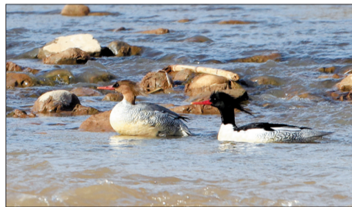
1月29日摄于汝河汝阳段

在此前后, 鸟友先后在洛河洛宁段、孟津黄河湿地及汝河附近发现了2只~6只不等的中华秋沙鸭。鸟类专家分析, 目前已可以确定洛阳为中华秋沙鸭的越冬栖息地之一, 估计每年在洛阳越冬的中华秋沙鸭有20只, 占全球总数的2%。