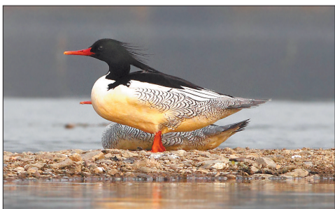
1月28日摄于洛河洛宁段

鸭科动物多在草丛或河滩筑巢繁殖, 中华秋沙鸭却一反常态。到繁殖期, 它们喜欢飞上枝头寻找天然树洞, 筑巢的树洞距离地面一般超过10米, 奇特的习性, 让它们显得尤为神秘。