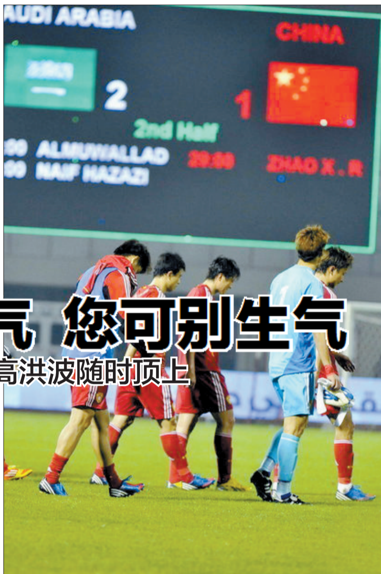
中国队球员失落退场

目前和中国队同组的伊拉克队首战小胜印度尼西亚队,从而和沙特队同积3分并列榜首。这样,中国队的出线前景已不容乐观。后面主场对伊拉克队和沙特队的比赛要尽力抢分,对印尼队更是不能丢分,这对现在的国足来说,难度很大。