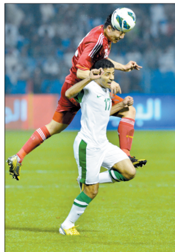
双方球员激烈拼抢