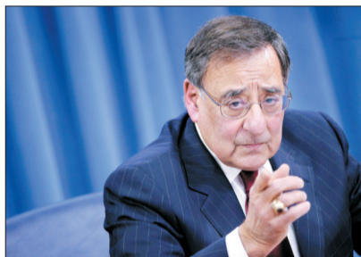
13日,美国防长帕内塔说,朝鲜已经对美国构成威胁