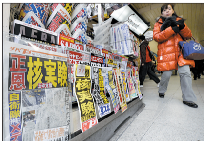
12日,日本许多报纸的头条都是关于朝鲜核试验的新闻