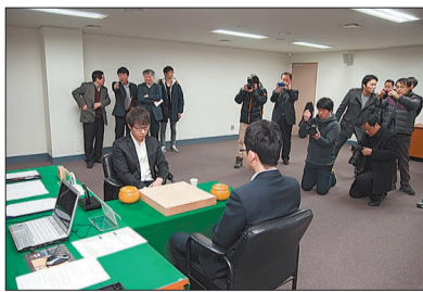
媒体关注巅峰对决