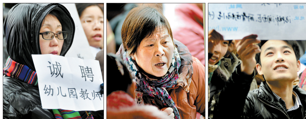
招聘会上各种表情

这几日,各种招聘会在我市轮番开场。然而,同样是求职,同样是逛招聘会,有人一击即中,有人却铩羽而归,什么原因呢?记者参加多场招聘会后发现一些特点,您不妨瞧瞧。