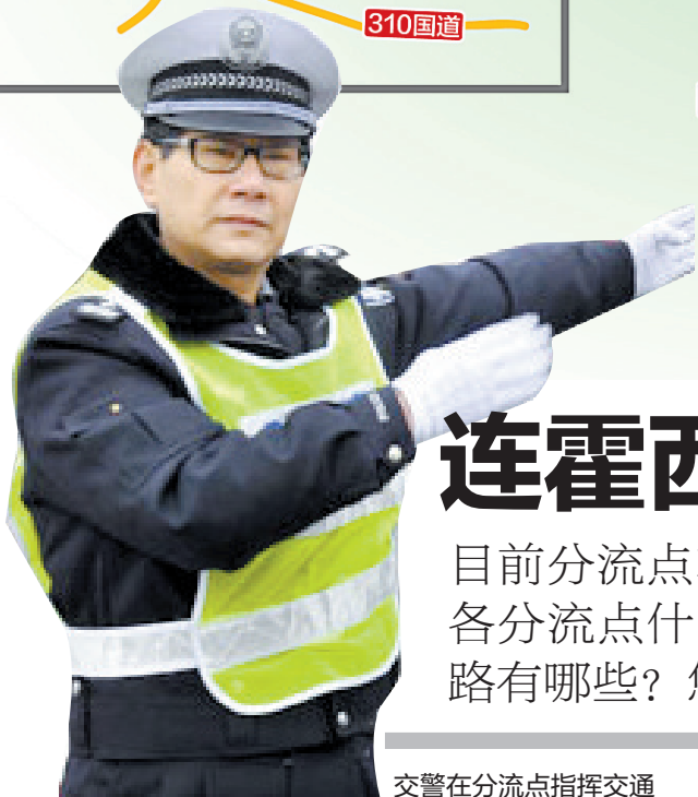
交警在分流点指挥交通

目前分流点车辆骤增, 高峰时排起千米长队。各分流点什么时段车流量最大? 具体绕行线路有哪些? 您不妨看看本报记者打探的信息