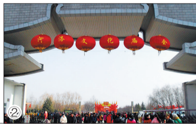
图② 隋唐城遗址植物园西门

2013年的洛阳春节可谓热闹非凡,年味儿、文化味儿、小吃的香味儿比比皆是。大红灯笼高高挂,一派节日的喜庆气氛。