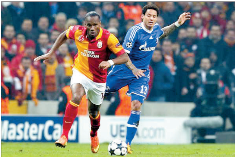
德罗巴(左)在比赛中