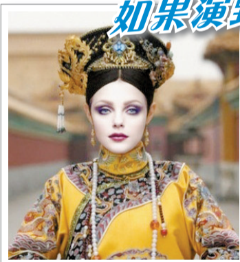
杰西卡版最有喜感