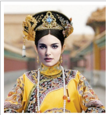
娜塔莎版最为神似