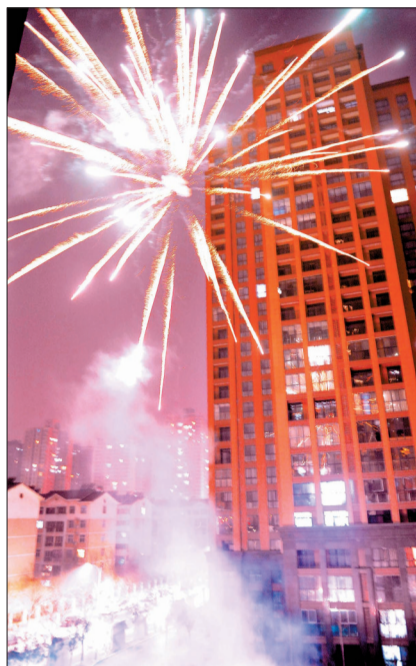
元宵夜市民燃放烟花

内不允许销售、购买和燃放烟花爆竹。今起,我市警方将联合市安监部门全面开展禁止燃放烟花爆竹专项工作。