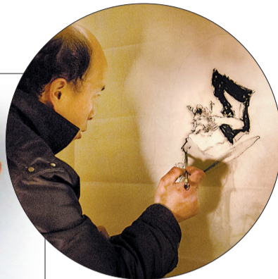
沿着投影印迹,描摹起来方便快捷