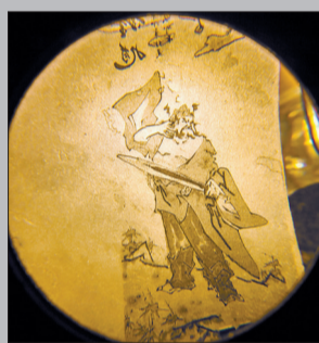
透过放大镜看“底片”