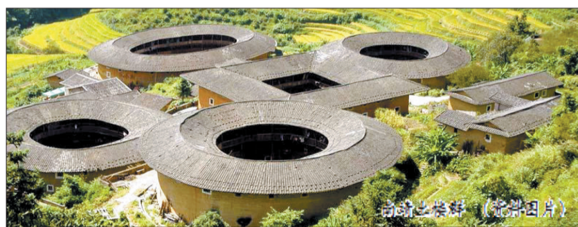
南靖土楼群 (资料图片)

央视《远方的家》栏目曾对广西边境线上的美景和民族风情进行过详细的探访。3月16日旅游者将跟随央视的脚步,深入广西边境线,不仅能体验中越边境风情,还将桂林、阳朔、德天瀑布、通灵大峡谷、凭祥、明仕田园等极品山水景点一网打尽,一次赏尽中国最美山水;往返8天,每人2980元。