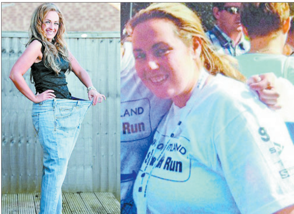
减肥成功的多伊尔