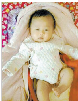
被害婴儿 (网络图片)