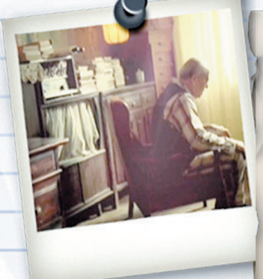
在百度上搜索视频《打包篇》即可观看 (本栏图片均为视频截图)