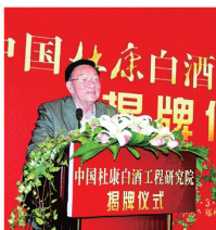
高级顾问:沈怡方 中国白酒专家组组长、中国白酒界泰斗、中国食品工业协会白酒专业委员会副会长