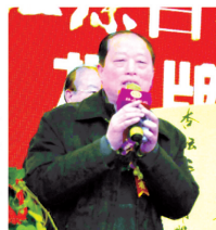
高级顾问:赖登燊 中国首届酿酒大师、中国著名白酒专家、国家级非物质文化遗产酿造技艺代表性传承人