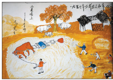
牛画作品《小麦场上》