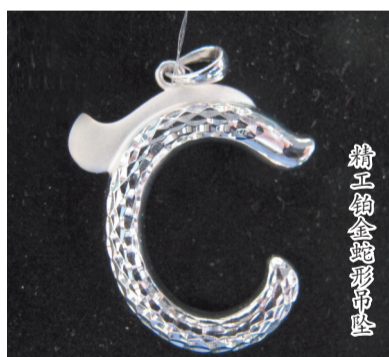
精工铂金蛇形吊坠