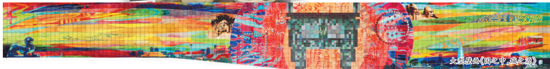
大型壁画《国之中,城之源》