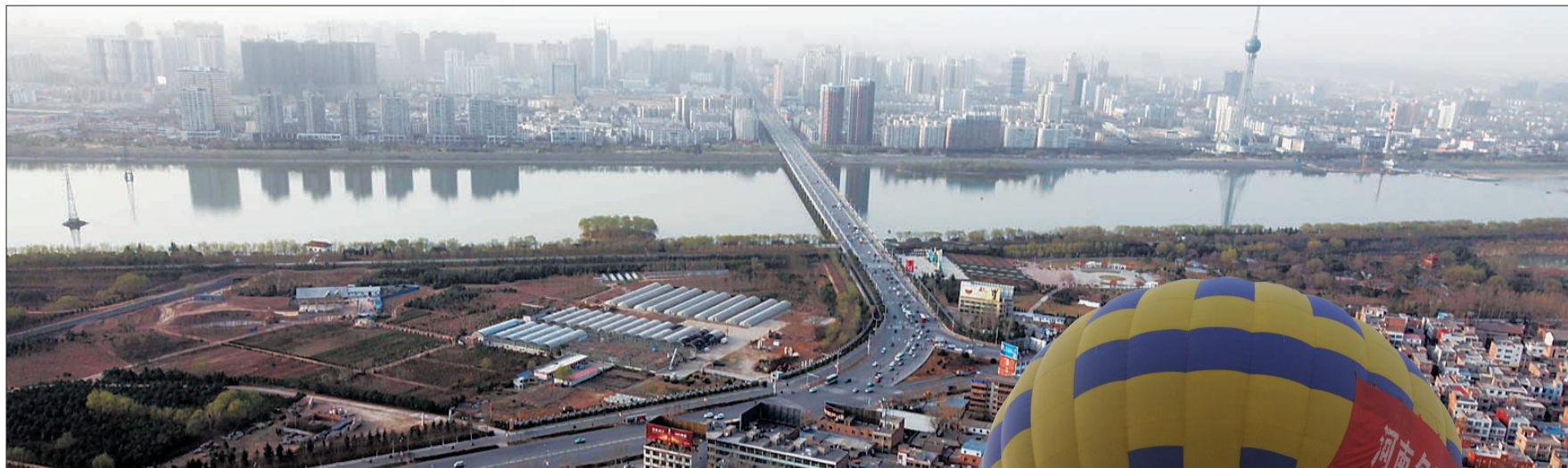
在热气球上从300米高空看洛阳