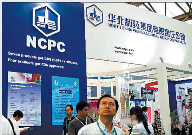
华北制药集团这回“摊上大事儿啦” (资料图片)

据了解,美国法院陪审团的裁决属于一审判决。为防止股价波动,华北制药集团16日下午已紧急停牌,并在当晚晚上发布公告称,公司尚未收到美国法院的正式判决文件,收到正式判决文件后将启动上诉程序,并按规定及时履行信息披露义务。华北制药集团高层表示,他们将积极应对,并已经作好上诉的准备,否则就意味着接受天价罚单并放弃市场份额。