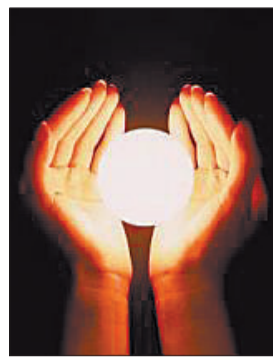
我希望儿子一进门就笑嘻嘻地说:“哎呀,老爸,家里还亮着灯,真好!”