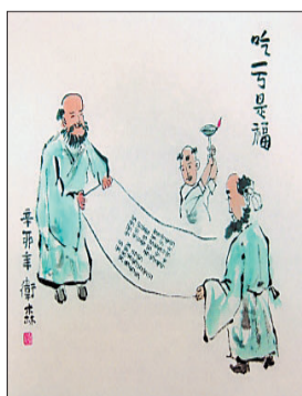
天道酬勤,人道酬情,人格也是资源。在这一点上,小王做到了极致。