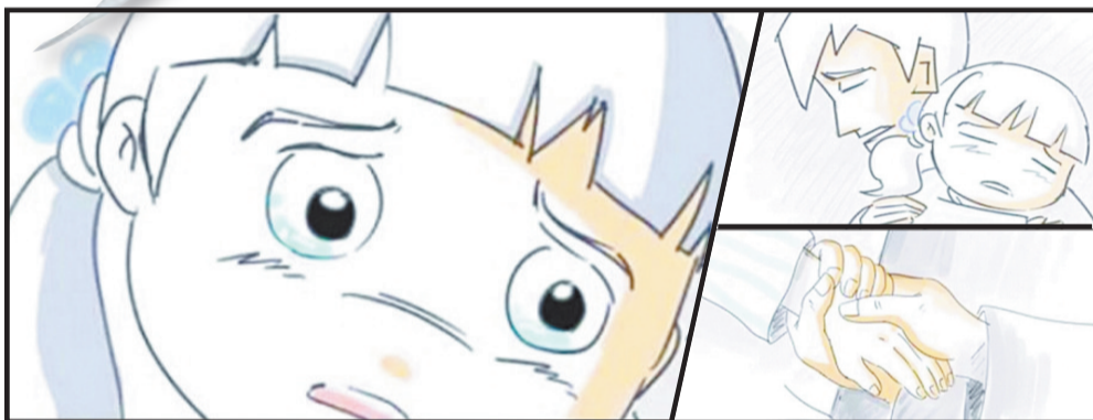
爸爸,我不想死,我害怕