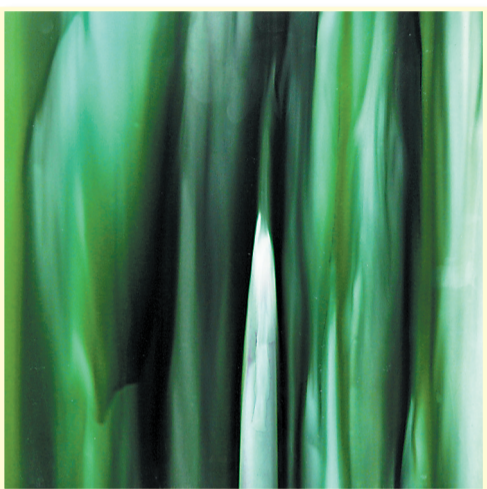
三彩艺作品《破土》 (入展2012中国当代国际陶艺展)