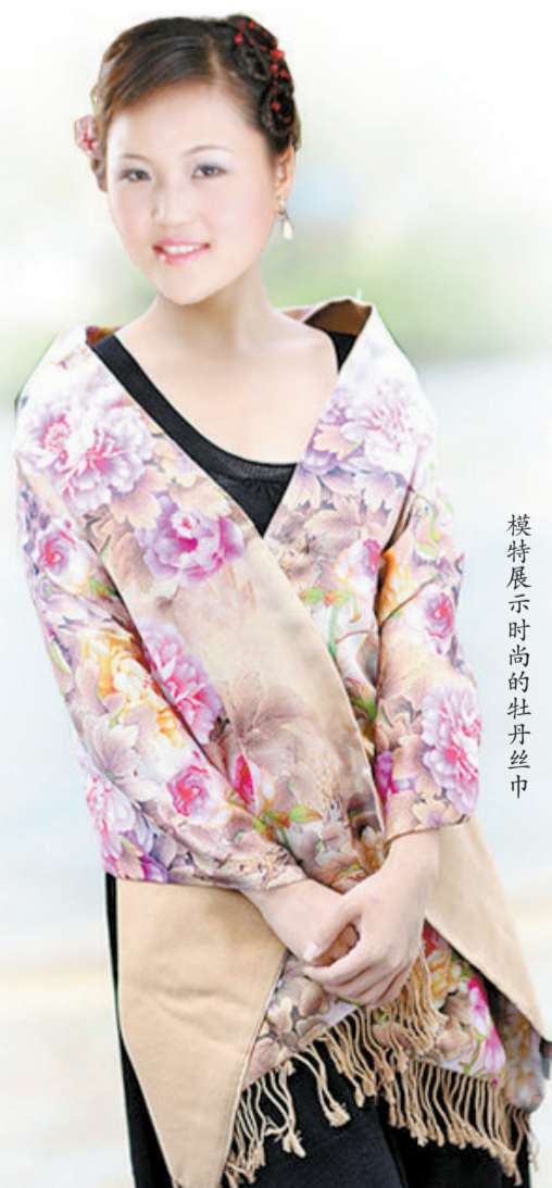
模特展示时尚的牡丹丝巾

参与“洛阳礼”巡礼活动,让您的企业和旅游商品走出洛阳,走向世界,让世界惊叹洛阳的创新,洛阳的发展。三彩艺、青铜器、唐三彩、牡丹瓷、牡丹画、牡丹茶、牡丹化妆品……啥是最给力的“洛阳礼”呢?有意参加“洛阳礼”巡礼活动者,请拨打电话:65233721、13838868975或13598175653。