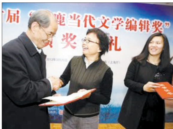
陈忠实(左一)给首届“白鹿当代文学编辑奖”获得者颁奖

3月20日,由作家陈忠实发起、人民文学出版社举办的首届“白鹿当代文学编辑奖”颁奖典礼在北京举行。陈忠实亲自为获奖编辑颁奖。