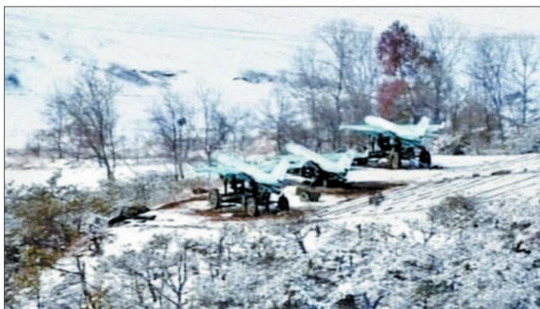
朝鲜首次公布无人机实战部署照片 (据中国日报网)

韩国情报部门分析称,朝鲜的此次训练是针对19日美军B-52轰炸机从关岛起飞在朝鲜半岛上空实施的训练。朝鲜外务省发言人曾警告说,若该轰炸机再次出现在朝鲜半岛上空,朝鲜将采取强有力的军事手段来进行应对。