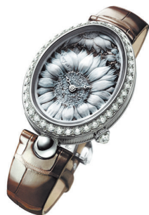
宝玑 Reine de Naples Cammea手表 浮雕表盘正是贝壳的微缩雕刻版本。