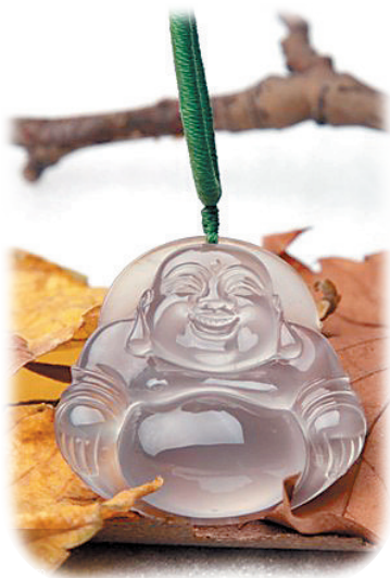
种水底交融, 静品意幽幽。 灵韵心间照, 纯美自天成!