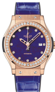
宇舶 Classic Fusion系列腕表 表盘采用的是青金石,如同深邃的天空。(小京)