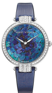
海瑞温斯顿 Premier Feathers腕表 表盘镶嵌传统经典的羽毛。