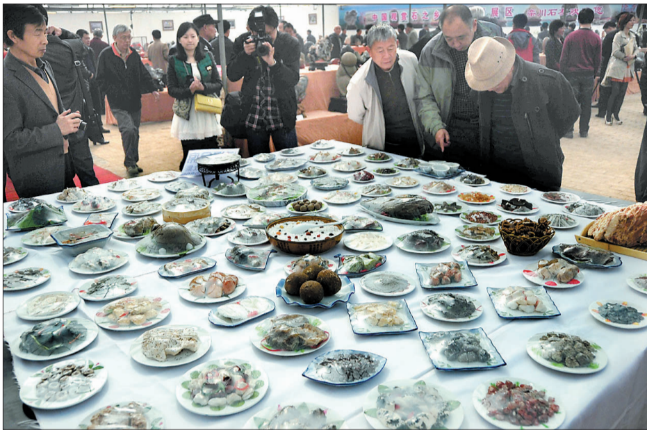
这桌“满汉全席”吸引不少人前来观赏