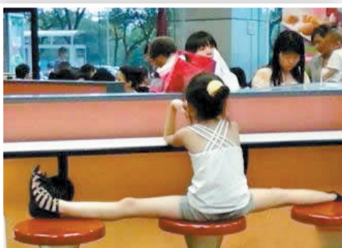
微博搞笑排行榜:小朋友,占个位置而已,不用这么霸气吧?