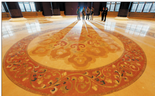
不同石材组成的图案