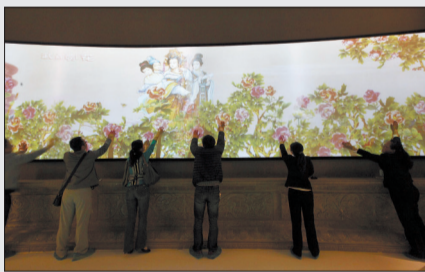
用手一点,花儿“绽放”

除了“步步生莲”,旁边的壁画也暗藏“玄机”。当人用手轻拍墙壁上的“花蕾”时,牡丹顿时盛开,当所有的牡丹都“绽放”后,“武皇”和众侍从在壁画中“亮相”。