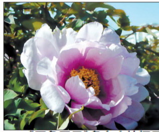
《国色天香》詹女士拍摄于王城公园