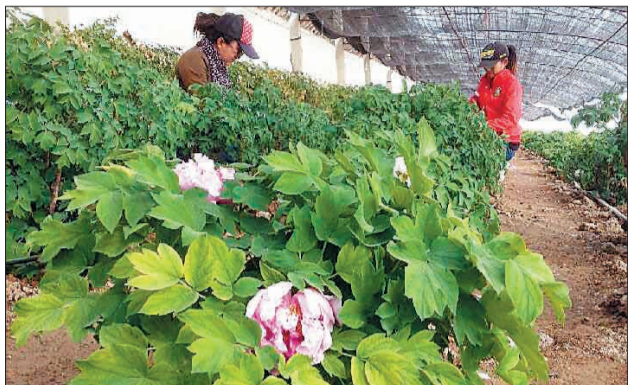
红星场的棚栽牡丹已开放